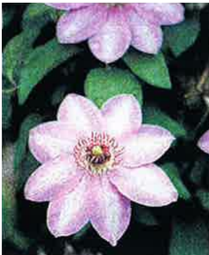
カザグルマ (クレマチス) (キンポウゲ科) 心の美しさ 高潔