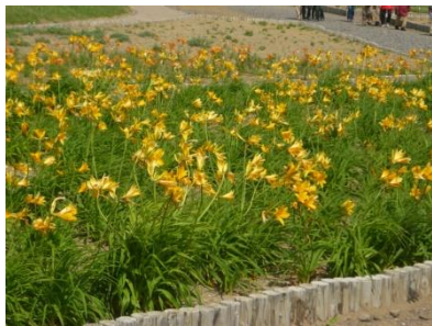
＜港の脇に咲くエゾカンゾウ＞ ニッコウキスゲ親戚

最近では体力の衰えで、三平峠の登りもきつく、しかし尾瀬の花々は見たいしとっておりましたら、北海道の礼文島へ行けば高山植物が海拔0メートルで見られると人伝てに聞きました。ここで昨年、ツアーで礼文、利尻島へ行ってきました。