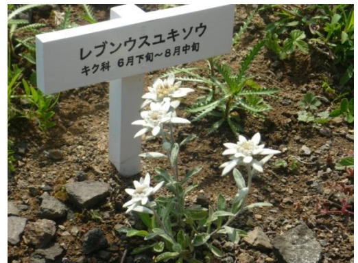
和製エーデルワイス

礼文島には稚内からフェリーで2時間。確かに海拔0メートルで高山植物の群落がみられます。