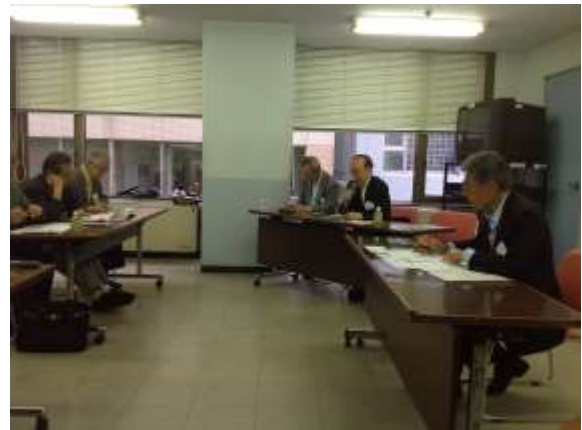
議案を説明する茂木副会長