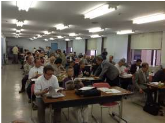
総会開始前の会場(402号室)