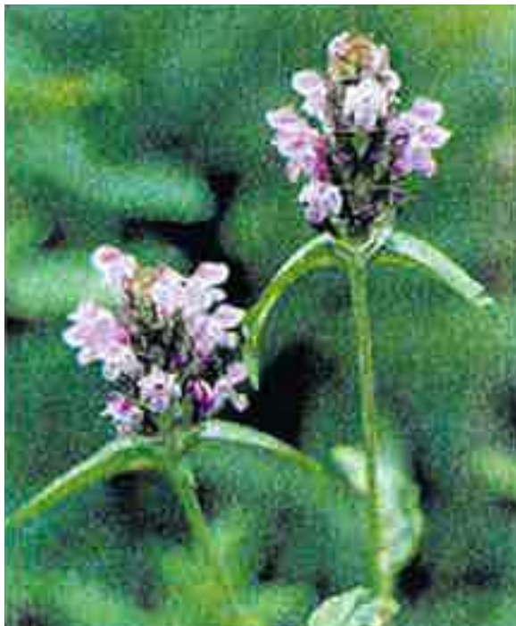
ウツボグサ (シソ科) 協調性