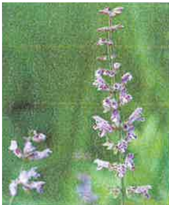
アキノタムラソウ （シソ科） 自然のままのあなたが好き