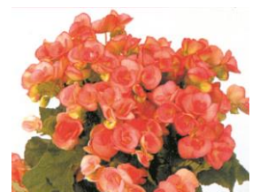
リーガースベゴニア (花言葉: 親切)