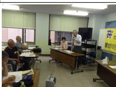
退任・新任理事・監事の挨拶（下三枚）