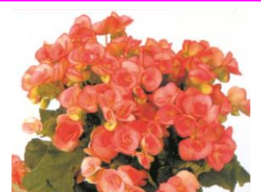
リーガースベゴニア (花言葉: 親切)