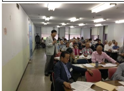
質疑応答の様子(中三枚)