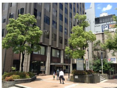
かながわ県民センター