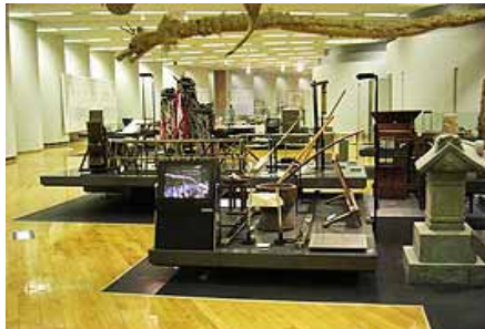
(火曜日) 市民ミュージアム・民俗資料