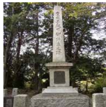
(金曜日) 「御野立落雁」昭和天皇御立所