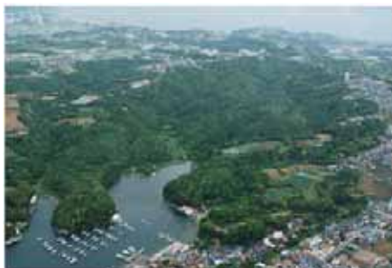
(木曜日) 小網代の森全景