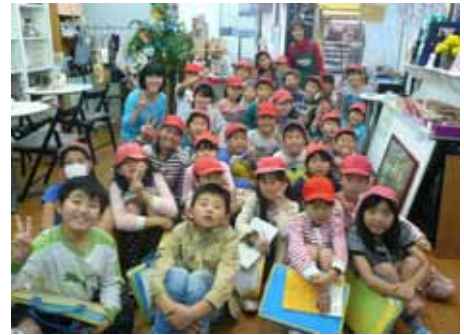
近隣の小学校の社会見学授業

・行政との交流も盛んだ。行政は地域活動の担い手育成に力を入れている。希望カフェは居場所づくり ・街の活性化・ボランティアが活躍している現場、として事例学習に最適であり、今年は横浜市、大和市の地域デビュー講座の見学会を受入れた。