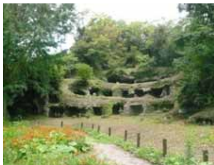
(火曜日) 名越切通内まんだ堂やぐら群