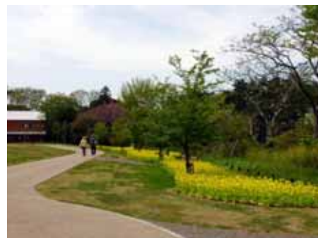
(金曜日) 侯野別邸庭園(旧住友庭園)