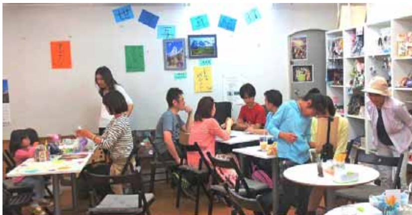
希望カフェに集う方々の様子

希望カフェは我々にとってまさに「人生は二幕目がおもしろい」の実践である。開店2年半、お客様も増え地域の憩いの場として定着してきたが、もっと盛り上げたい。みなさんもいっしょに楽しみませんか。3人称活動を応援していただければありがたい。