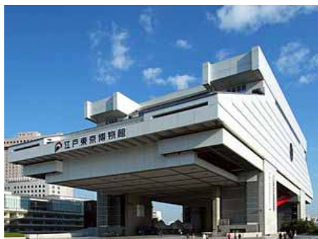
(木曜日) 江戸東京博物館(両国)