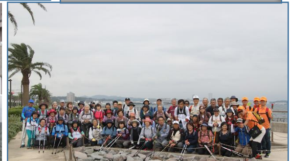
2班 うみかぜの道にて集合写真