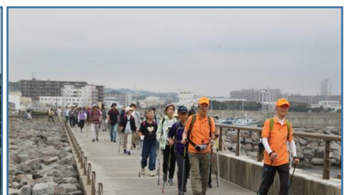
うみかぜの道をウォーキング