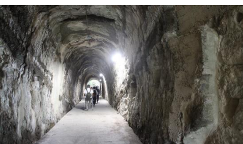
素掘りのトンネル内にて撮影