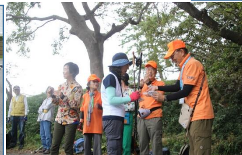
大抽選会 in 旗山崎公園