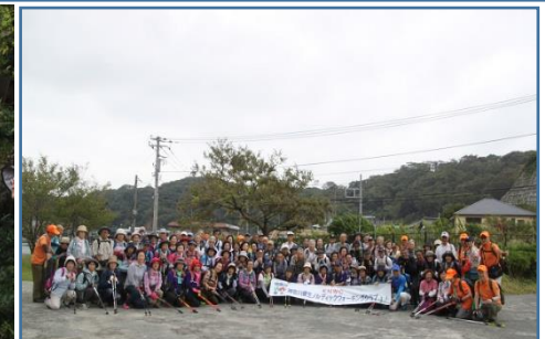
旗山崎公園にて 集合写真