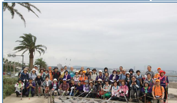
1班 うみかぜの道にて集合写真