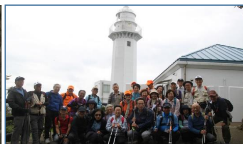
観音崎灯台 集合写真