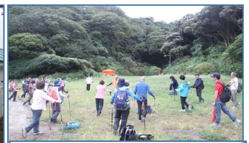
クールダウン お疲れ様でした。