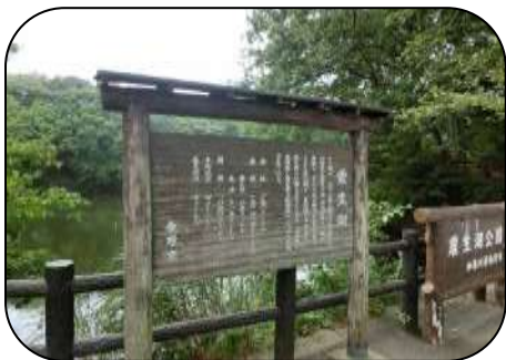
静かな震生湖は癒されます

集合場所：小田急・秦野駅改札口 (雨天中止：申込先に問合せ) 日時：平成25年10月29日(火)9時45分集合 (受付：9:15～) 参加費：無料 (レンタルポールは別途500円) 募集締切：10/15(火) 募集人数：40名 (申込順 定員になり次第しめきり)