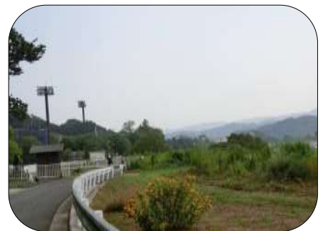
運動公園もある中井中央公園

【コース】 秦野駅～今泉名水桜公園～白笹稲荷～震生湖(3.5km)～中井町・里やま休憩所(計6.5km)(昼食休憩)～あしがら乳業(見学)～中井中央公園(解散：14時半頃)(計約9km・震生湖までは登り道ですが、後は下り道です) ※解散後は、「中井中学校前」バス停(約5分)まで案内。(秦野駅南口行き、約20分)