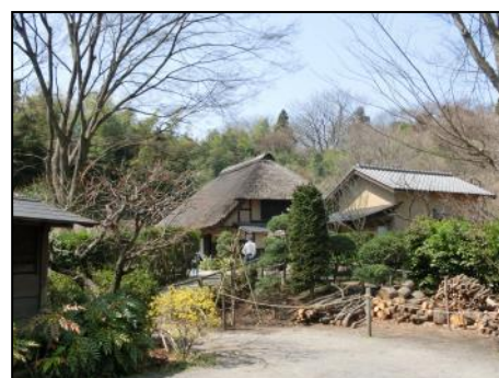
【小谷戸の里・古民家】

・コース:舞岡駅~舞岡ふるさと村・虹の家(受付)~小川アメニティ散策路~爪久保の家~小谷戸の里~おおばなの丘(約5km、昼食休憩)~ばらの丸の丘~前田の丘~尾根道~虹の家(解散:14時頃)【舞岡駅まで約10分】【計約7km】 【昼食解散の方(約4km)は、近くに(京急ニュータウンバス停)があります】