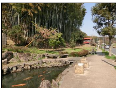
【公園までは小川アメニティ・遊歩道で】