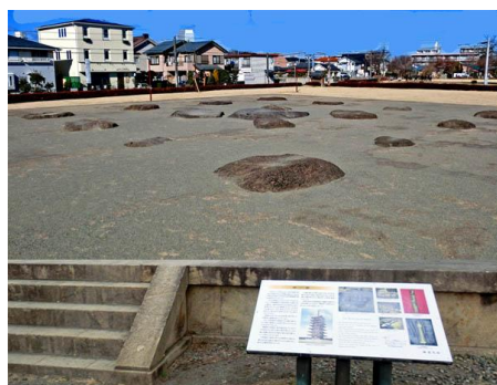
天平の礎石が語る 国分寺跡