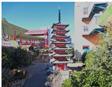
3分の1の七重の塔モニュメント

例：横浜駅 (急行海老名行8時41分) ~大和駅 (9時03分) ~かしわ台駅 (9時10分)