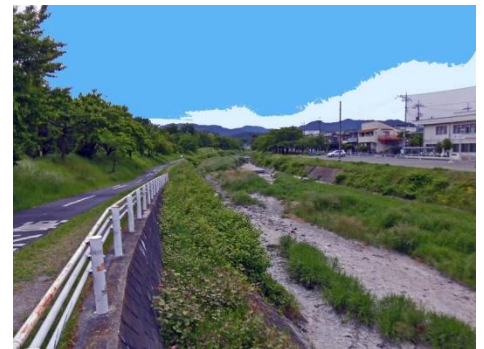
高尾の山並も望める南浅川遊歩道

・コース：多摩森林科学園・入園料300円(ウォーミングアップの後、園内一周60分ウォーク)～武蔵陵墓地(参拝)～都立陵南公園(昼食)～南浅川遊歩道～千人町桑の実公園(クールダウン)～JR西八王子駅 14時30分頃解散予定