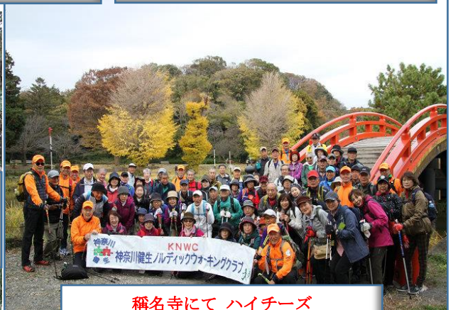
稱名寺にて ハイチーズ