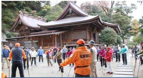
瀬戸神社で ウォーミングアップ

2018(H30)年 12月 02日(日曜日)9時30分~13時40分・距離:約8km・天候 曇り空 17℃ 生憎の曇り空ではありましたが、結局雨には降られることなく 参加者76名(内スタッフ11名)で 金沢八景のノルディックウォーキングを楽しみました。ウォーキングコースは以下の通りです。 京急金沢八景駅~瀬戸神社(集合)~平潟湾プロムナード~野島公園展望台~旧伊藤博文別邸 ~ バーベキュー場前~海の公園柴口(昼食)~稱名寺・金沢文庫~谷津公園(解散)~金沢文庫駅