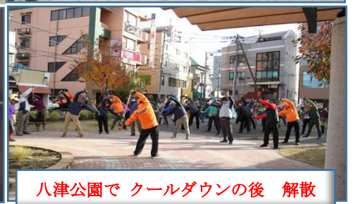
八津公園で クールダウンの後 解散