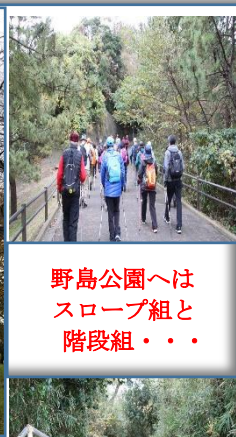
野島公園へは スロープ組と 階段組・・・