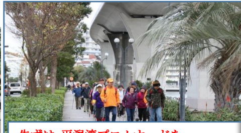
まずは 平潟湾プロムナードを ノルディックウォーキング!!