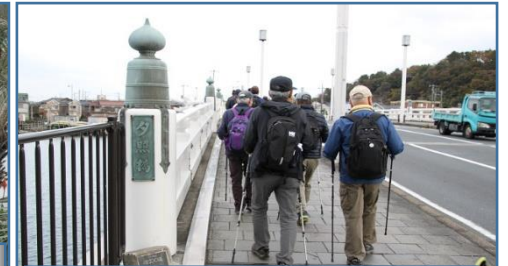
夕照橋 (かながわの橋 100選)