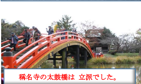
稱名寺の太鼓橋は 立派でした。