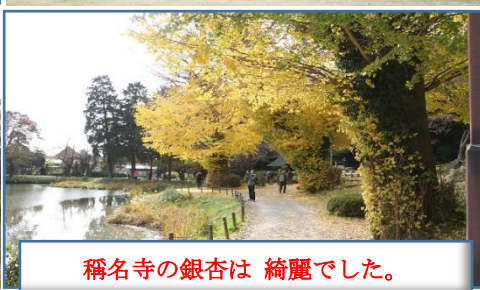
稱名寺の銀杏は 綺麗でした。