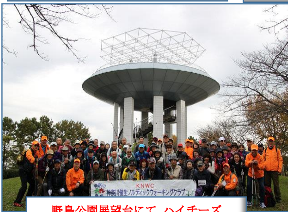
野島公園展望台にて ハイチーズ