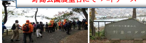
野島公園から下山?