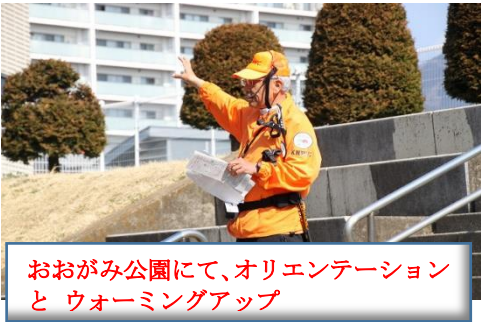
おおがみ公園にて、オリエンテーションとウォーミングアップ

2019年3月17日(日)9時30分～13時30分 距離 約8km 天気 晴れ 15℃。春爛漫の季節となり参加者119名(内スタッフ12名) 秦野水無川遊歩道・戸川公園 NW を楽しみました。秦野水無川沿いには、新しくなったカルチャーパークで休憩をとり、途中7世紀代の桜土手古墳群の保存されている公園で見学休憩を取り、雄大な丹沢山系に抱かれた県立秦野戸川公園までを楽しみました。上流の土手は「 おかめ桜 」と「 菜の花 」のコントラスト風景が楽しむことができ、公園内では雄々しい「風の吊り橋」や「河津桜や他の花々」を楽しめました。参加者の皆様には、非常に満足頂く事ができました。