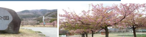
戸川公園山頂にて、ゴール間近