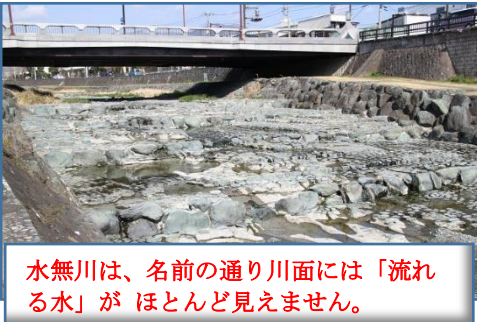
水無川は、名前の通り川面には「流れる水」がほとんど見えません。