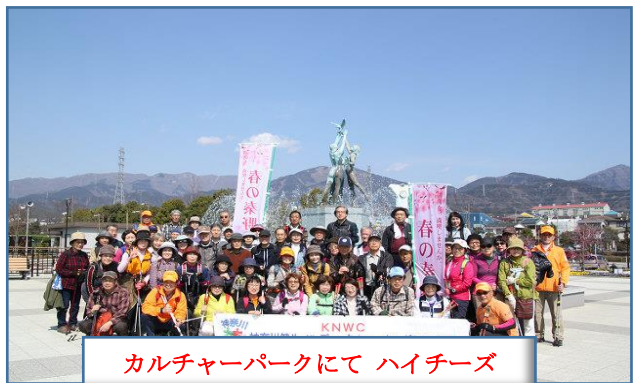
カルチャーパークにてハイチーズ