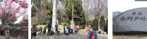
おかめ桜・菜の花ともに満開