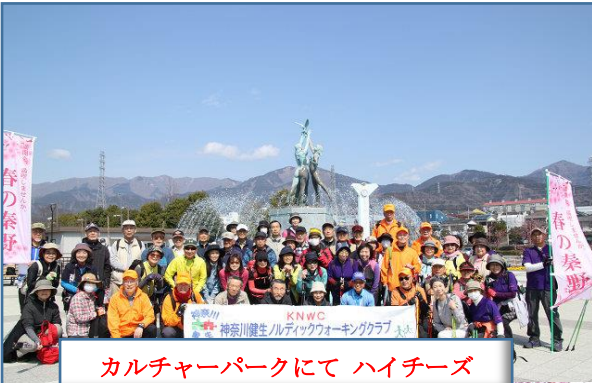
カルチャーパークにてハイチーズ