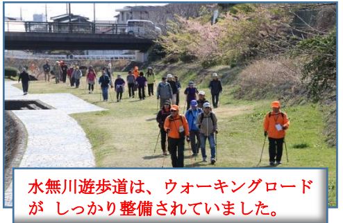
水無川遊歩道は、ウォーキングロードがしっかり整備されていました。