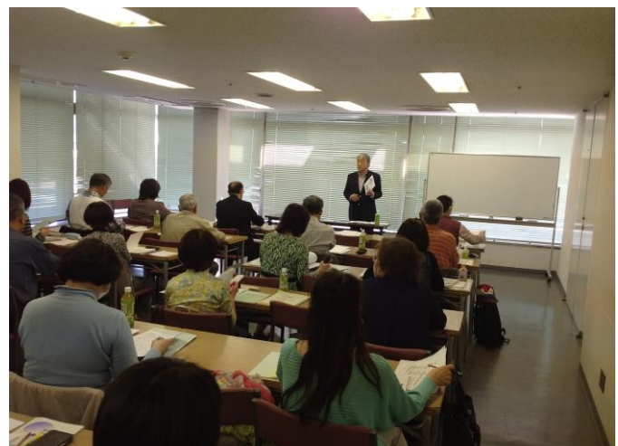
健康生きがづくりアドバイザー養成講座

中高年が心豊かに過ごすための「ライフプランセミナー」、行政と協働による「団塊世代の地域デビュー支援講座」、「健康生きがづくりアドバイザー養成講座」など各種セミナーを開催しています。さらにご要望に応じて経験豊かな講師も派遣しています。