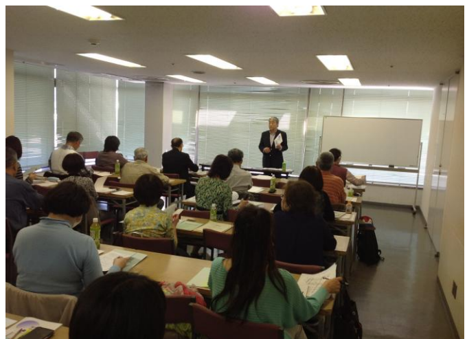
健康生きがいきづくりアドバイザー養成講座

中高年が心豊かに過ごすための「ライフプランセミナー」、行政と協働による「団塊世代の地域デビュー支援講座」、「健康生きがいきづくりアドバイザー養成講座」など各種セミナーを開催しています。さらにご要望に応じて経験豊かな講師も派遣しています。