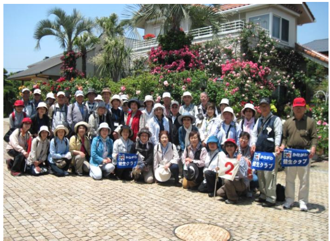
大磯散策・オープンガーデンめぐり

神奈川健生主催の「かながわ健生クラブ」は神奈川の自然、歴史、文化、産業をメインテーマとして活動しています。ご夫婦など約150名の方が登録され、年10回県内の名所、旧跡、工場見学などを楽しみながらご案内し仲間づくりにもつながっています。