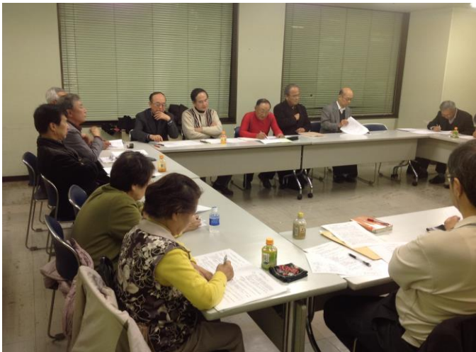
議案審議の様子2 第3号議案審議ではかなり白熱した議論