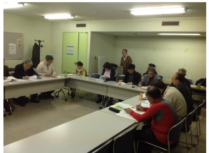
出席者が定足数に達し、総会成立を報告 する奈良部事務局副幹事（後方）