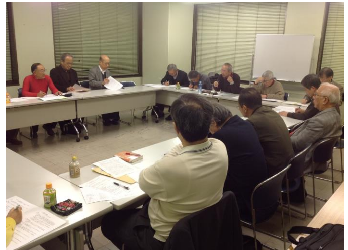
大下副会長も途中からオブザーバー参加 (左上中央)