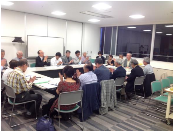
第 1 号から第 4 号議案が全議案が承認 され拍手で総会が終了