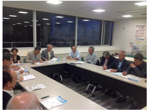
最後に川合氏から 3 点情報提供が あった。

神奈川健生成年後見センター リーフレット（神奈川健生の 全会員 216 名に配布済み）