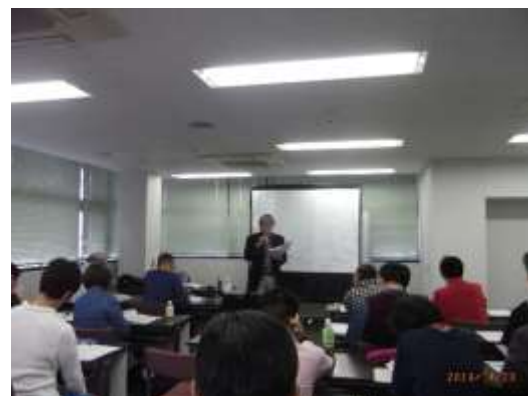
健康・生きがいがづくり養成講座

また、HPに登録講師のプロファイルの公開、健康生きがいがづくりアドバイザーの知名度向上、講師活動を通して地域に貢献を図ることを目的にしています。