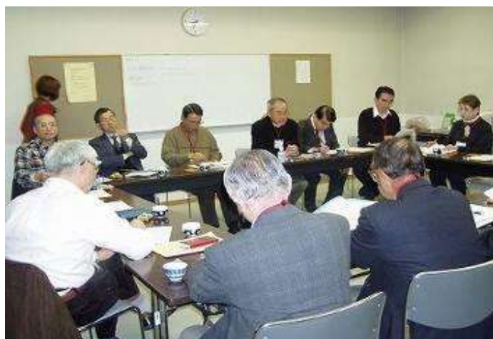
地区ネット定例会