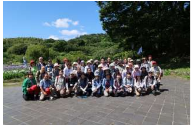
226 回木曜会 自然観察の森 上郷森の家

健康生きがいくりにかかわるテーマを選び、年 10 回程度をめどに定例活動を行います。季節に相応しいテーマを掲げ開催日時は原則、木曜または火曜の日中の時間帯を設定し、活動いたします。