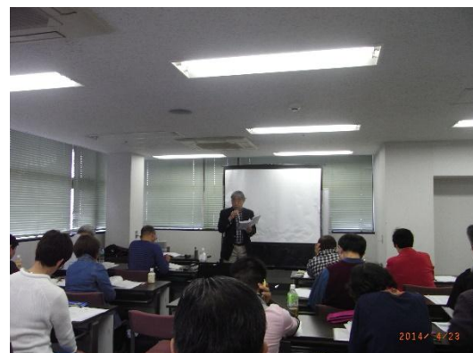
健康・生きがいがづくり養成講座

また、HP に登録講師のプロフィールの公開、健康生きがいがづくりアドバイザーの知名度向上、講師活動を通して地域に貢献を図ることを目的にしています。