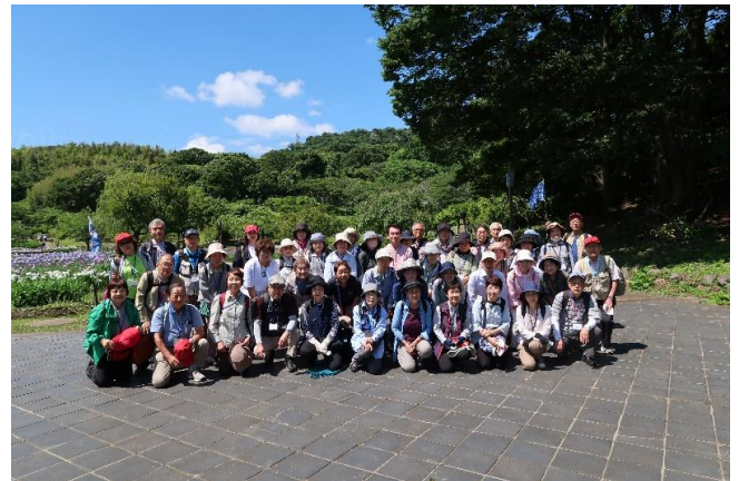
226 回木曜会 自然観察の森 上郷森の家

健康生きがいがづくりにかかわるテーマを選び、年 10 回程度をめどに定例活動を行います。季節に相応しいテーマを掲げ開催日時は原則、木曜または火曜の日中の時間帯を設定し、活動いたします。