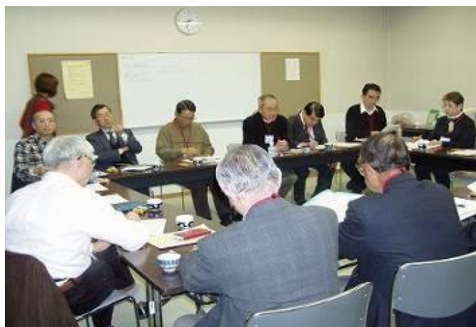
地区ネット定例会