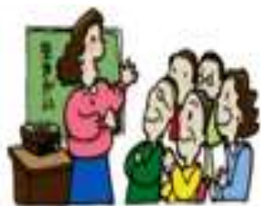
健康・生きがいづくり啓発