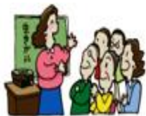
健康・生きがいづくり啓発