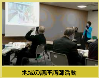
地域の講座講師活動