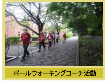
ポールウォーキングコーチ活動