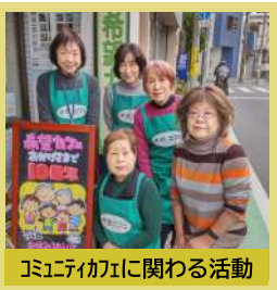
コミュニケーションに関わる活動