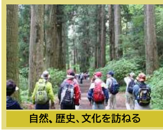
自然、歴史、文化を訪ねる

このほか 各種サークル活動や 地域で情報交換定例会など、 幅広く活動しています。