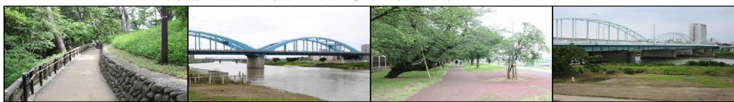
多摩川台公園 多摩川丸子橋 二十一世紀桜並木 多摩川大橋