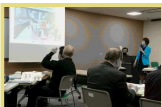
地域の講座講師活動