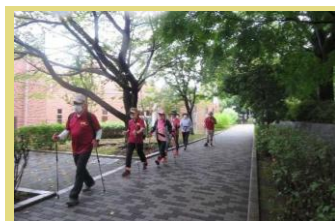
ポールウォーキングコーチ活動