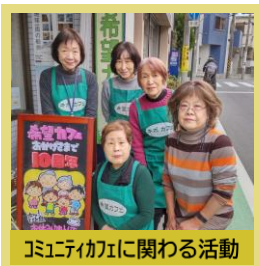
コミュニティに関わる活動